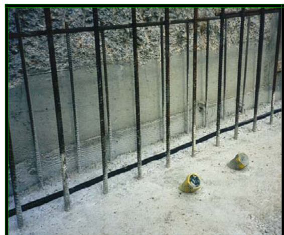
Waterstop en arranque de muro fijada con adhesivo