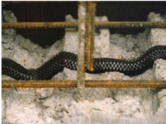
Adaptación al soporte

2. Desenrollar el Waterstop RX101 ® y 'presentarlo' con la cara negra contra el hormigón, apretándolo firmemente contra éste para que se ajuste correctamente a las posibles zonas re-hundidas que existan. Cuando se haya colocado una suficiente cantidad de Waterstop RX101 ® quite el papel desechable.