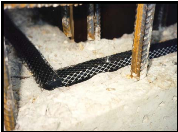
Unión en esquina de junta Waterstop RX sin solaparse.

4. Para unir los tramos de malla metálica, haga contactar los finales de éstas sin solaparlos.