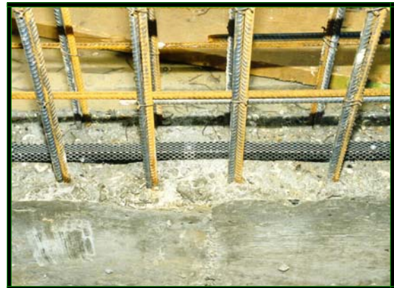
Waterstop fijada con malla DK-NET

Waterstop RX101® trabaja tanto con presiones hidrostáticas continuas como intermitentes. Ha sido diseñado para su uso con hormigón armado con una o dos mallazos, y con un espesor mínimo de 175 mm, asegurando un recubrimiento mínimo de hormigón de 75 mm por todos los lados de la junta.